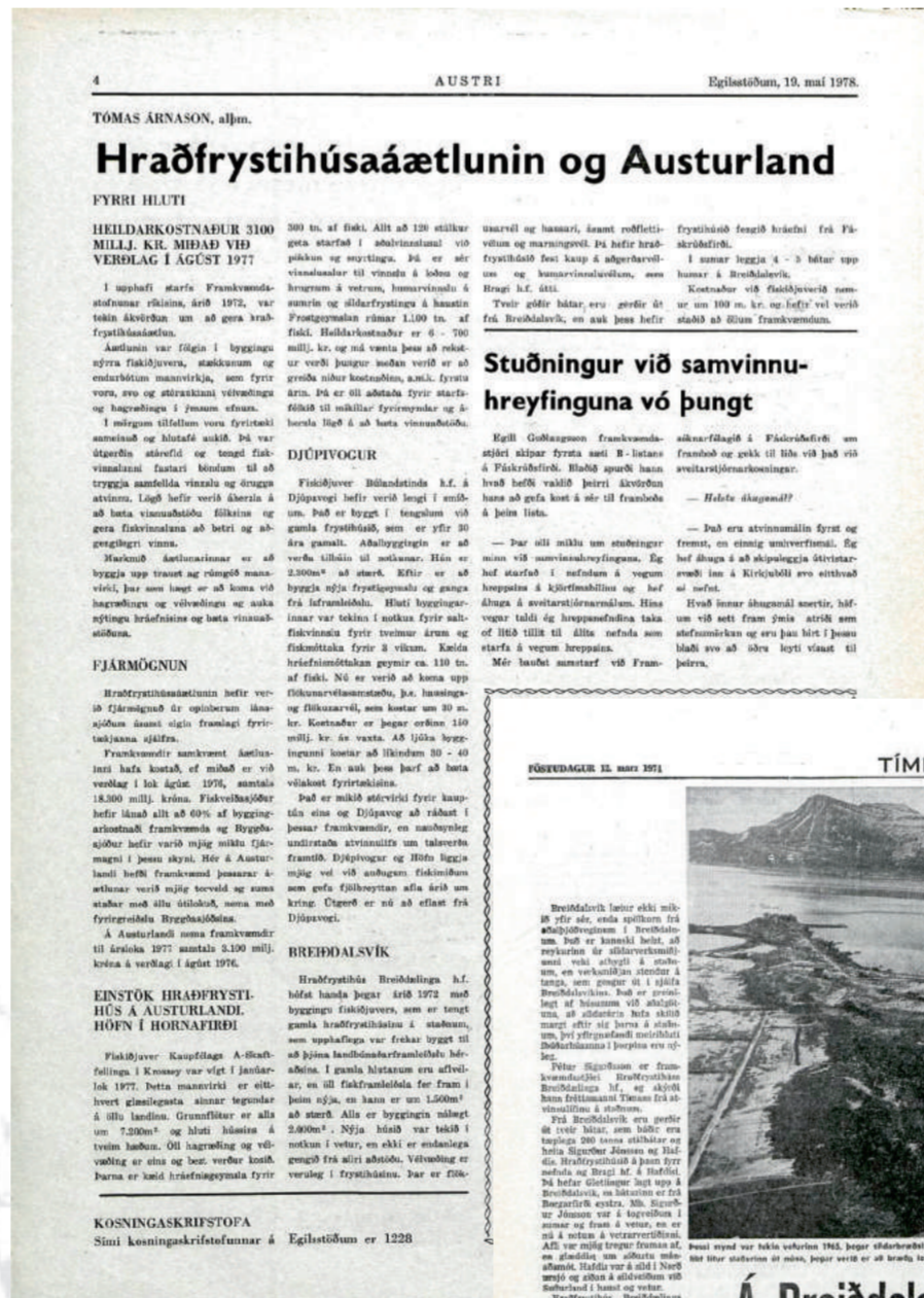
Austri 19. mai 1978 og Tíminn 12. mars 1971