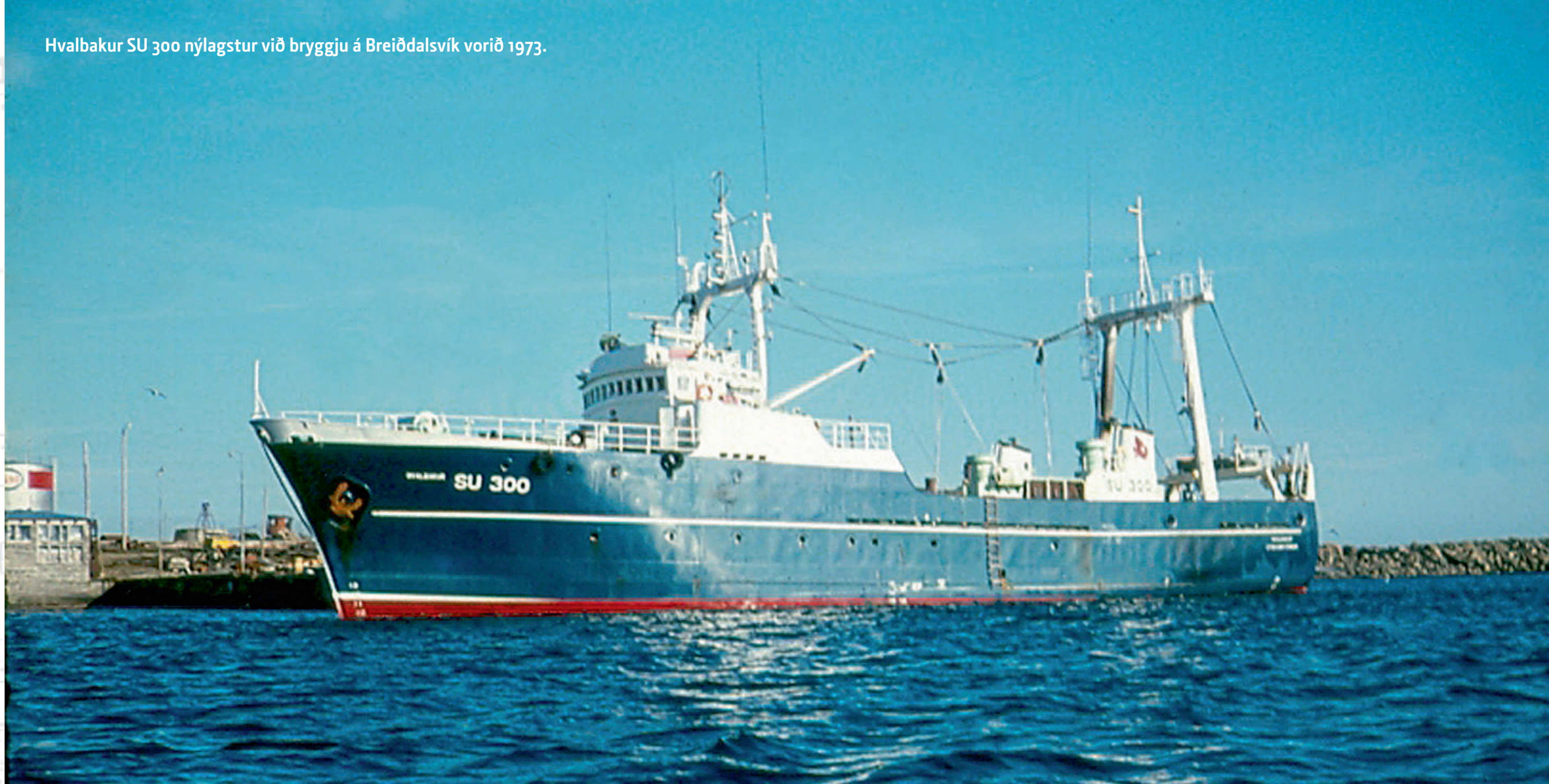
Hvalbakur SU 300 nýlagstur við bryggju á Breiðdalsvík vorið 1973.