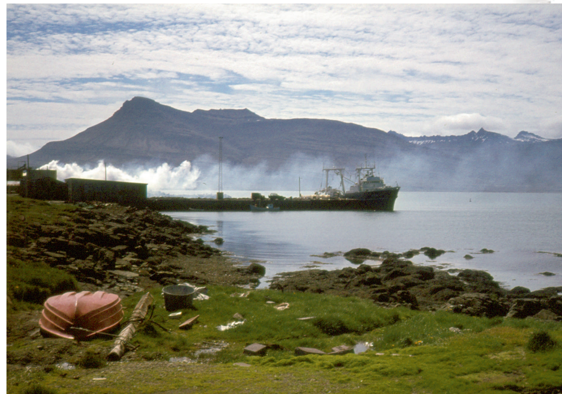
Loðna brædd um miðjan 8. áratuginn. Hvalbakur SU 300 við bryggju.