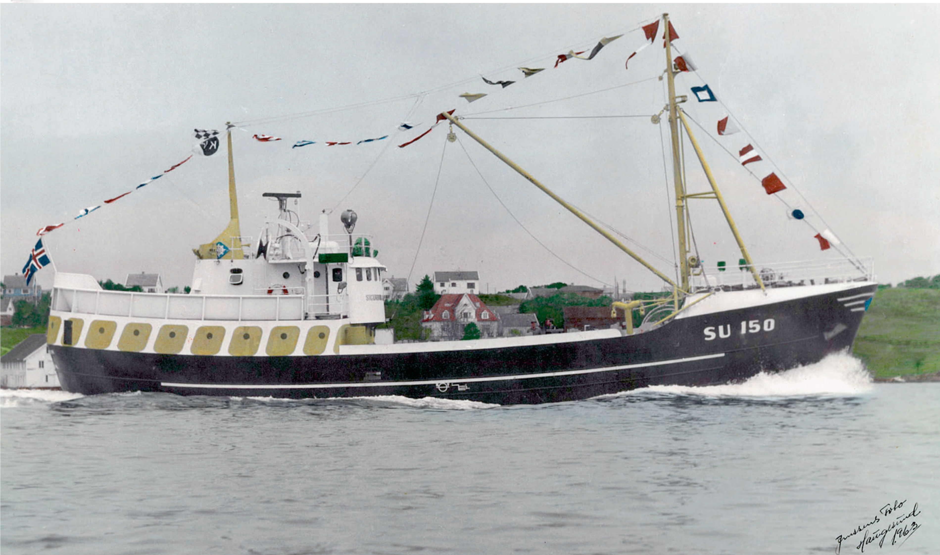
Sigurdur Jónsson SU 150 á heimleið frá Haugasundi 1963