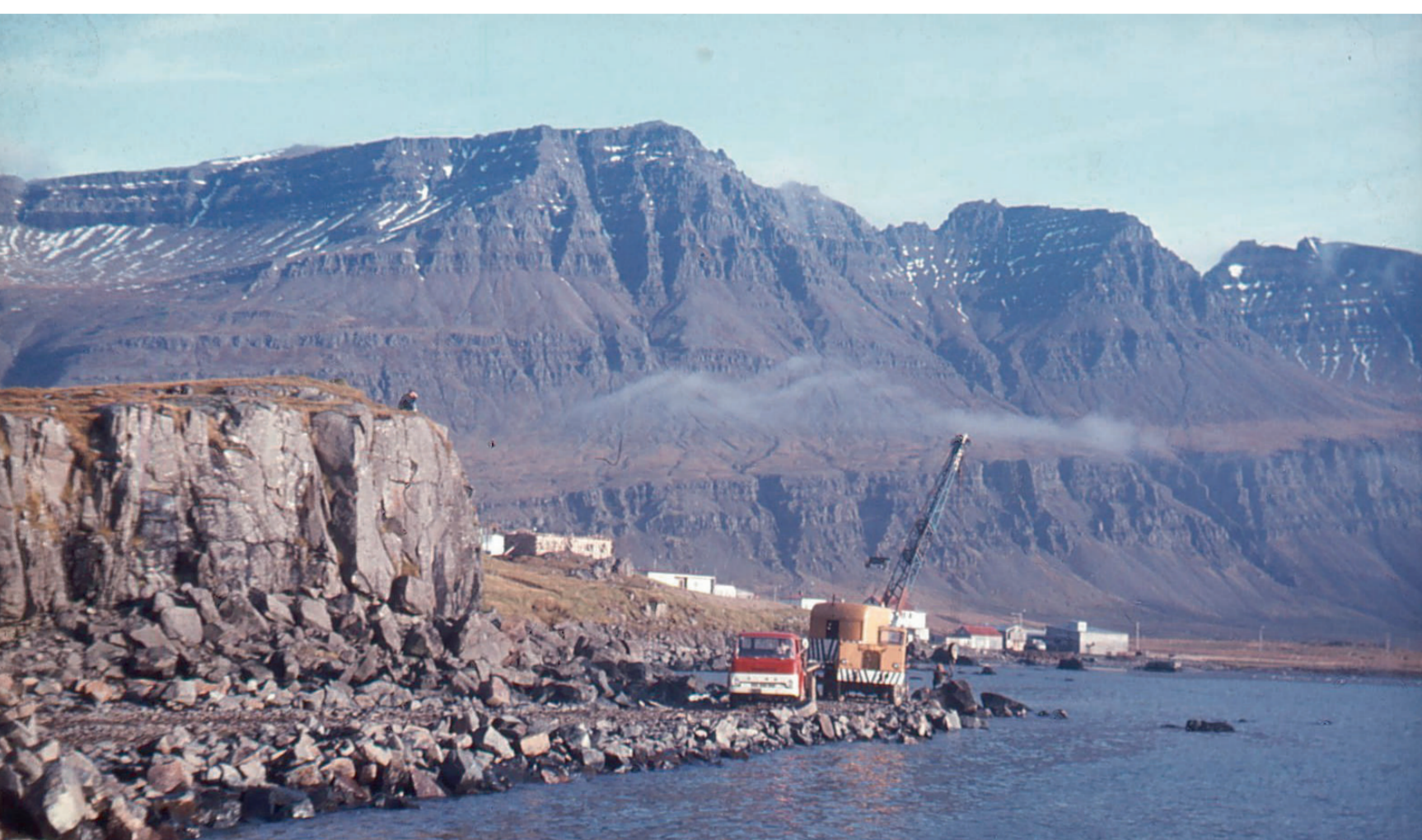
Grjót sótt í Þórðarhvamni vegna hafnargerðar á 8. áratuginum.