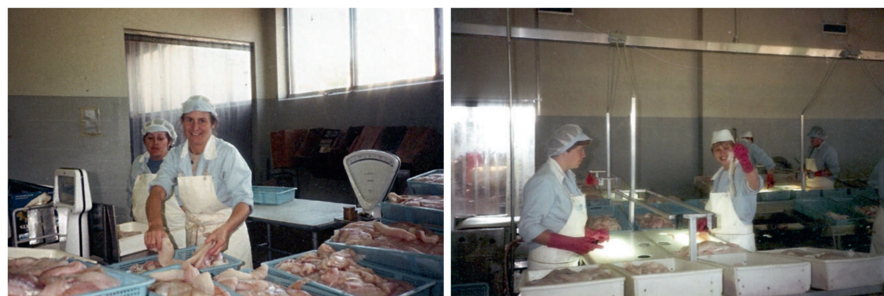
Úr vinnslu nýja frystihússins um 1980.

Af öllu þessu leiddi að yfirleitt var næga atvinnu að hafa á Breiðdalsvík – og einn þurfti að reida sig á vinnuframlag aðkomumanna. Íbúar Breiðdalsvíkur voru meðal þeirra sem lögðu hlutfallslega mest til þjóðarbúsins og á það var oftlega minnt á að hér var atvinnuleysisskráning óþekkt fyrirbrigði.