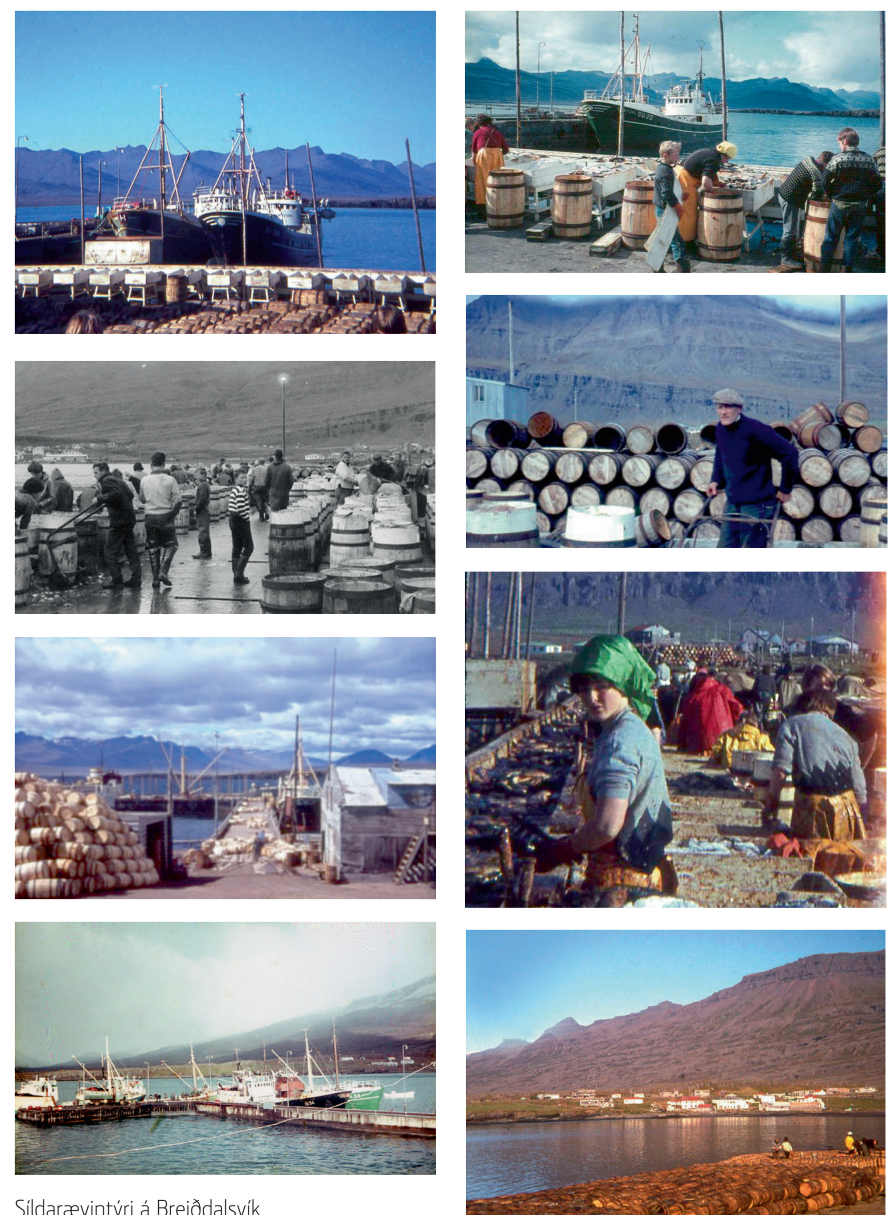
Síldarævintýri á Breiðdalsvík.

Þetta voru uppgangstímar á Breiðdalsvík, íbúum fjölgaði og ný íbúðarhús voru reist. Vinnufúsir aðkomumenn hópuðust til staðarins enda næg vinna handa öllum og uppgripstekjur fyrir þá sem báru sig eftir þeim. En eins og fyrri daginn lætur silfur hafnsins rómantískar stemningar í landi sig einu gilda, sama hvort sem er á Siglufirði eða Breiðdalsvík. Austfirska síldarævintýrinu var að ljúka – árið 1968 hófst hrundið.