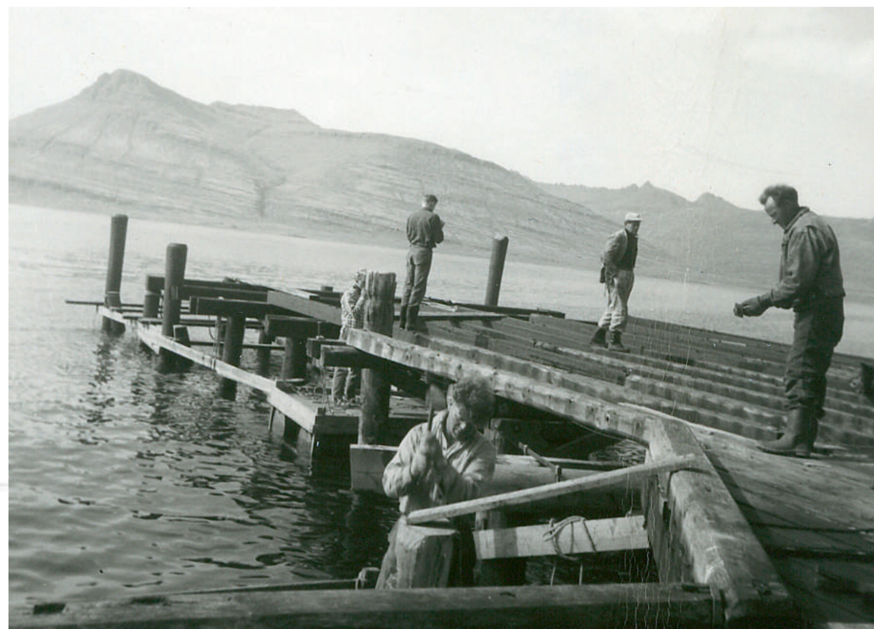
Hafnargerð á 6. áratugnum.

Útgerðarskilyrði voru nú orðin öll önnur og jafnvel stærstu strandferðaskipin áttu að geta athafnað sig á Breiðdalsvík – skip allt að þúsund lestir, sagði í blaðafegnum með óduldu stolti! Á þetta reyndi að vísu ekki fyrr en árið 1954 er Heklan lagðist að bryggju á Breiðdalsvík og skipaði upp heilum vörubíl! Sagði það meira en mörg orð um umskiptin. Og alfarið var hætt að afgreiða skip úti á vík eftir frekari stækkun og viðgerð á bryggjunni árið 1959.