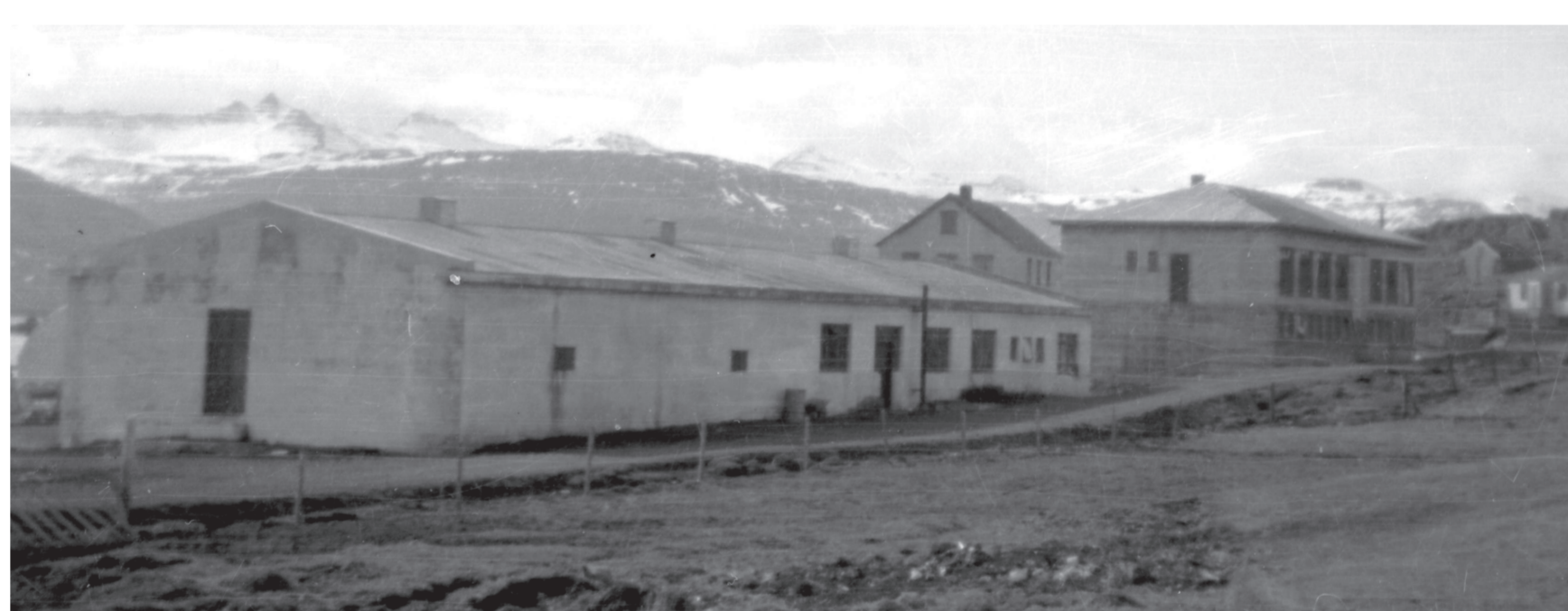
Frystihúsið og nýja kaupfélagið á 6. áratugnum.