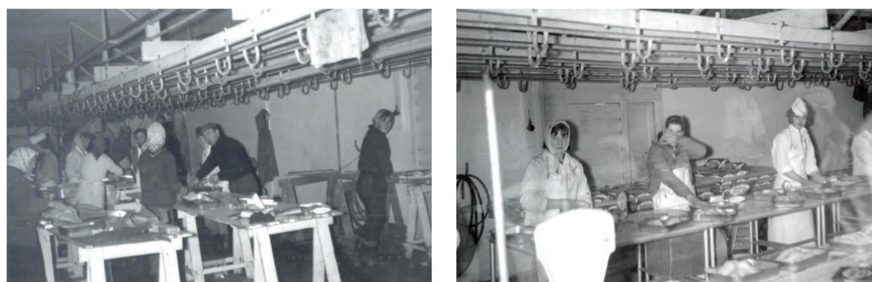
Úr vinnsluál frystihússins á 6. áratugnum.

Frystihúsið reis hægt og bitandi á næstu árum uns tekið var til óspilltra málanna árið 1948. Þá um haustið var fryst allt kjöt sem til féll í sláturhúsinu. Verulegt magn af dillakjöti var pakkað og fryst í neytendapakningar. Nú stóð það helst fyrir þrifum að bátarnir öfluðu ekki nóg og óhagkvæmt var að halda þeim til veiða frá Breiðdalsvík nema hluta úr ári. Því gekkst frystihúsið í að láta smíða fyrir sig 76 tonna eikarbát í Danmörku. Hlaut hann nafnið Hafnarey SU110 og kom til heimahafnar á gamlársdag 1958. Bætti báturinn verulega úr hraefnisskortri. Árið 1961 bættist Bragi SU210 við, 90 tonn að stærð. Samnefnt útgerðarfélag átti og gerði bátinn út en að því stóðu hraðfrystihúsið og fleiri. Bátarnir tveir gátu sótt á fjarlægari mið og útgerð þeirra skapaði um 50 störf beint og enn fleiri óbeint. Hafnarey og Bragi gerðu út á línu og net, árið um kring, oftast nær frá heimahöfn og gengu til síldveiða á sumrin.