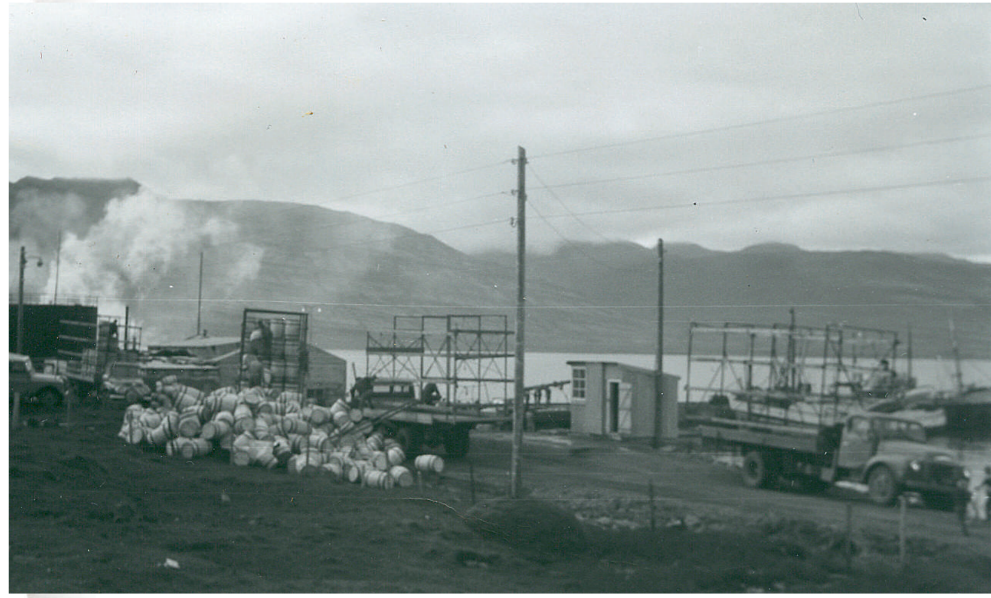
Bræðslureykinn leggur yfir hafnarvæðið á 7. áratugnum.