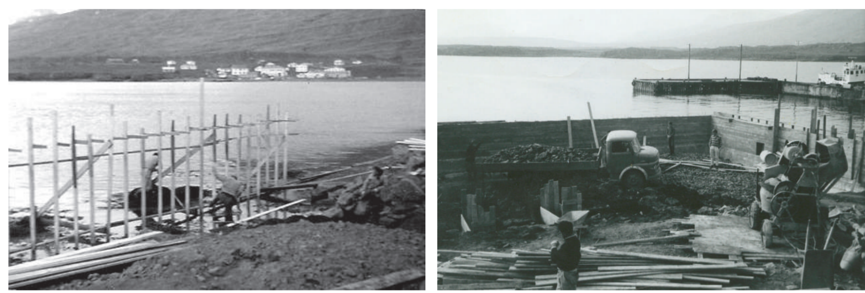
Unnið að uppplætti fyrir síldarplani Gullrúnar og að því að fylla grunn Sildariðjunnar.

Að öllu þessu var unnið skipulega á næstu árum á Breiðdalsvík, hafskipabryggja var gerð í nokkrum skrefum, hraðfrystihús reist og bátar komu til hafnar, stórir og smáir. Og brátt kom árangur erfiðisins í ljós, íbúum Breiðdalsvíkur tók að fjölga á ný og framundan voru síldarar með öllu því sem slíku ævintýri fylgir.