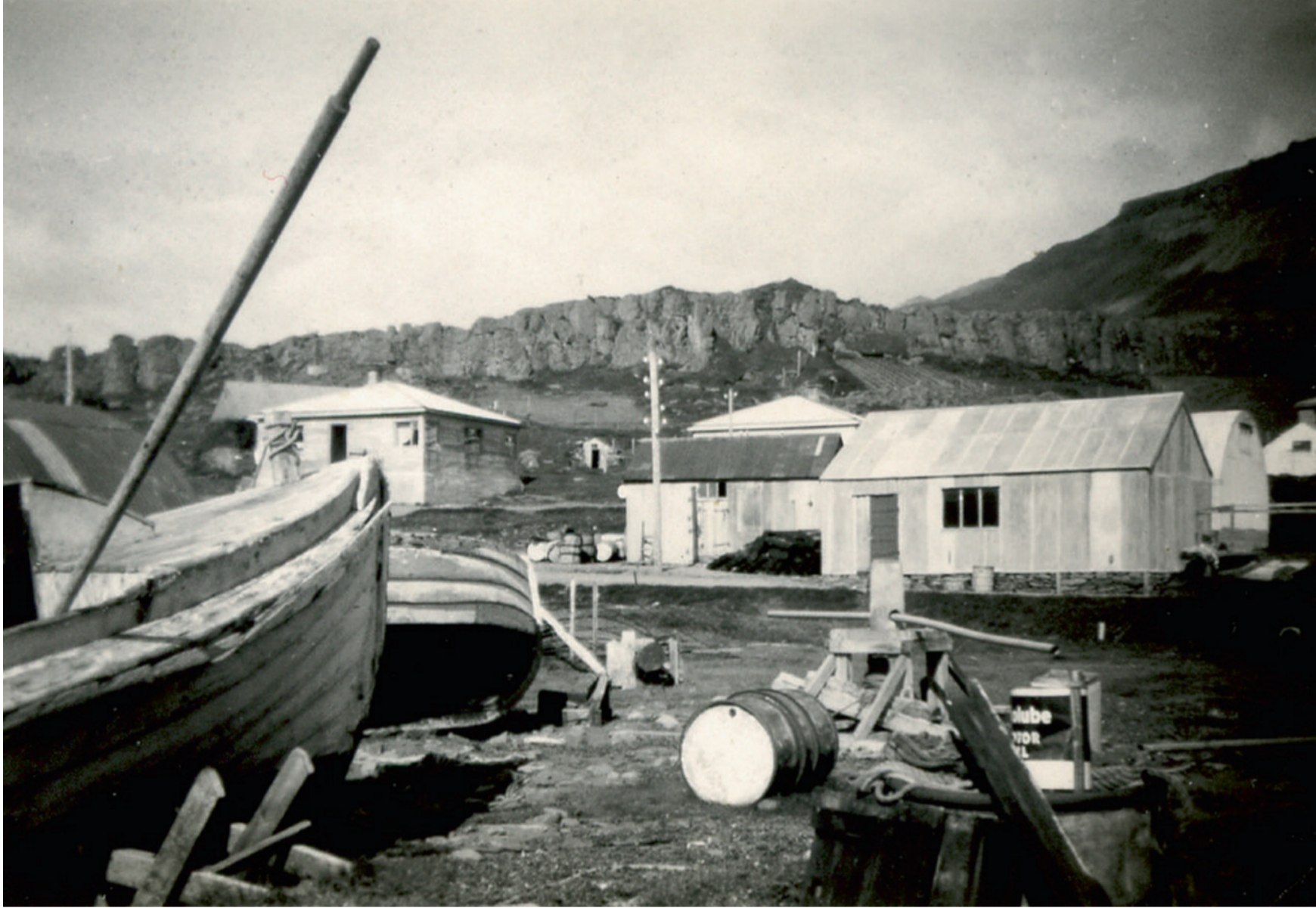
Leik og athafnasvæði Breiðdalsvíkur um 1940.

Hinn 10. maí 1940 kom breskur her til Reykjavíkur og lagði undir sig landið á næstu vikum. Í desember var loks komið að hernámi Breiðdalsvíkur er þangað kom þríeyki úr breska sjóhernum. Breiðdalsvík varð þar með strandvarðstöð, ein af 40 vítt og breytt um landið. Strandverðirnir höfðu það hlutverk að fylgjast með skipa- og flugferðum.