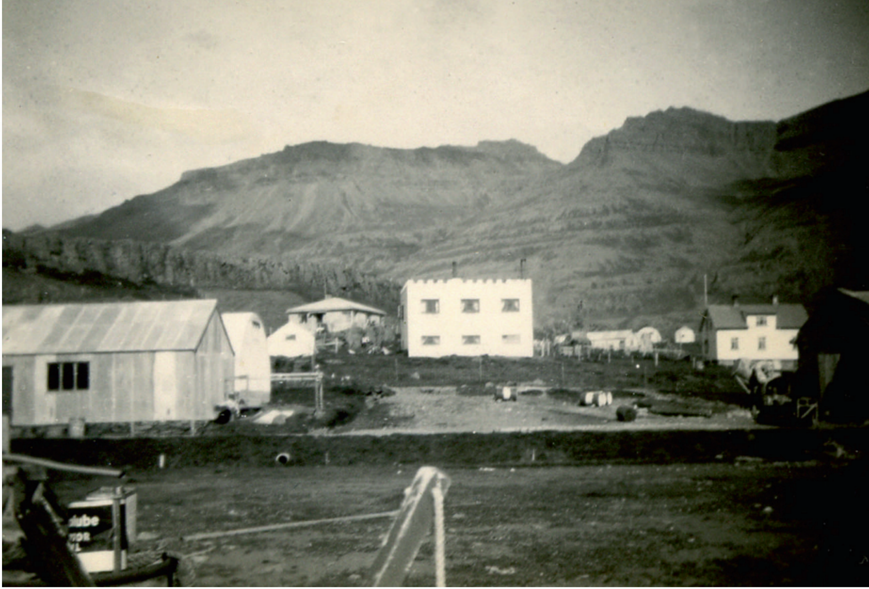
Breiðdalsvík á árum seinna stríðs, vettvangur mini-heimsstyrjaldar.