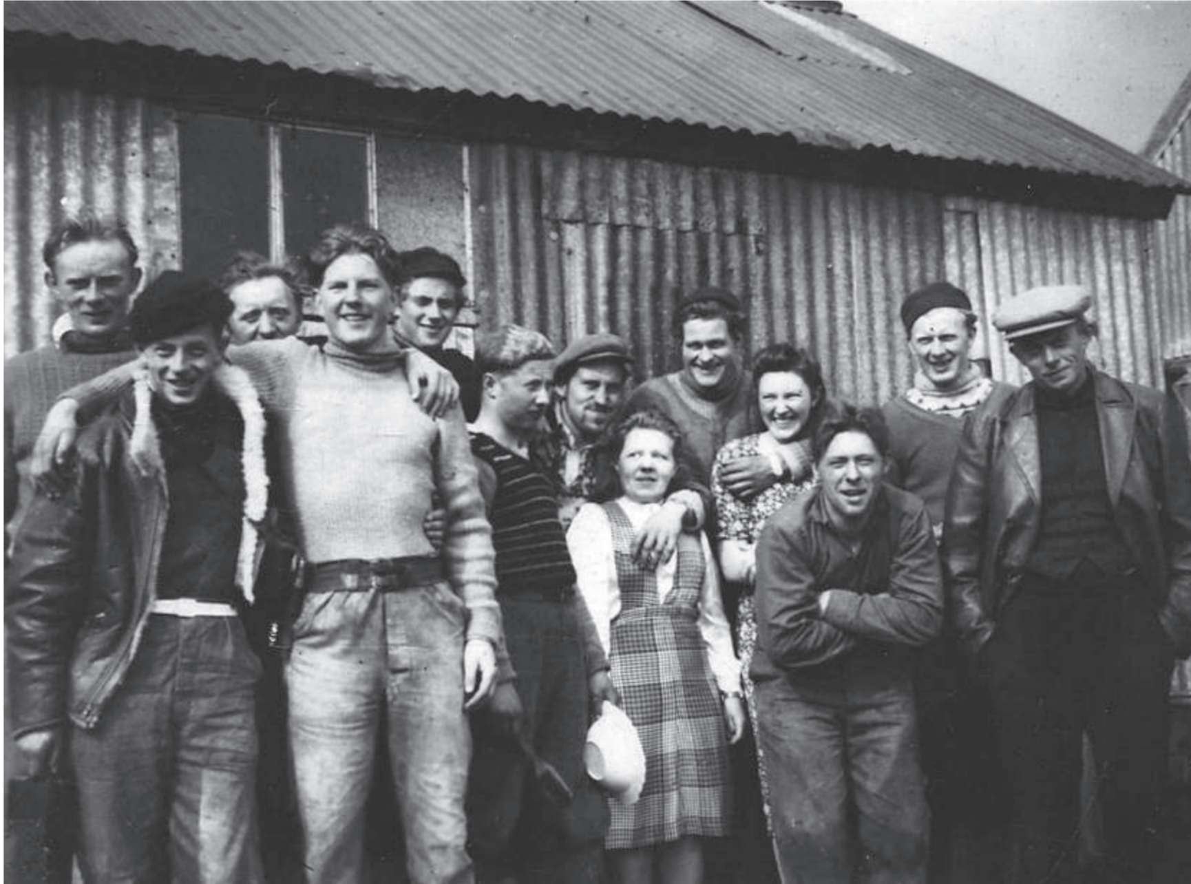
Fyrir framan „Hótel Sukk“ 1941.