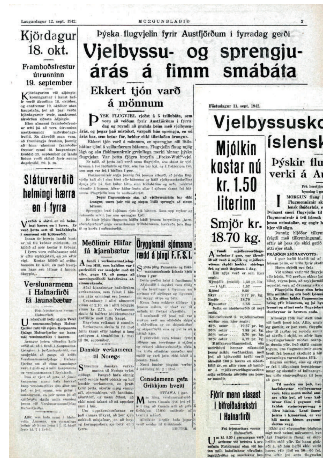
Fréttir af árásinni á Breiðdalsvík í september 1942. Hernaðaryfirvöld bönnuðu að greint yrði frá því opinberlega hvar þýska flugvélin bar niður og því er Breiðdalsvík aldrei nefnd í fréttinni.