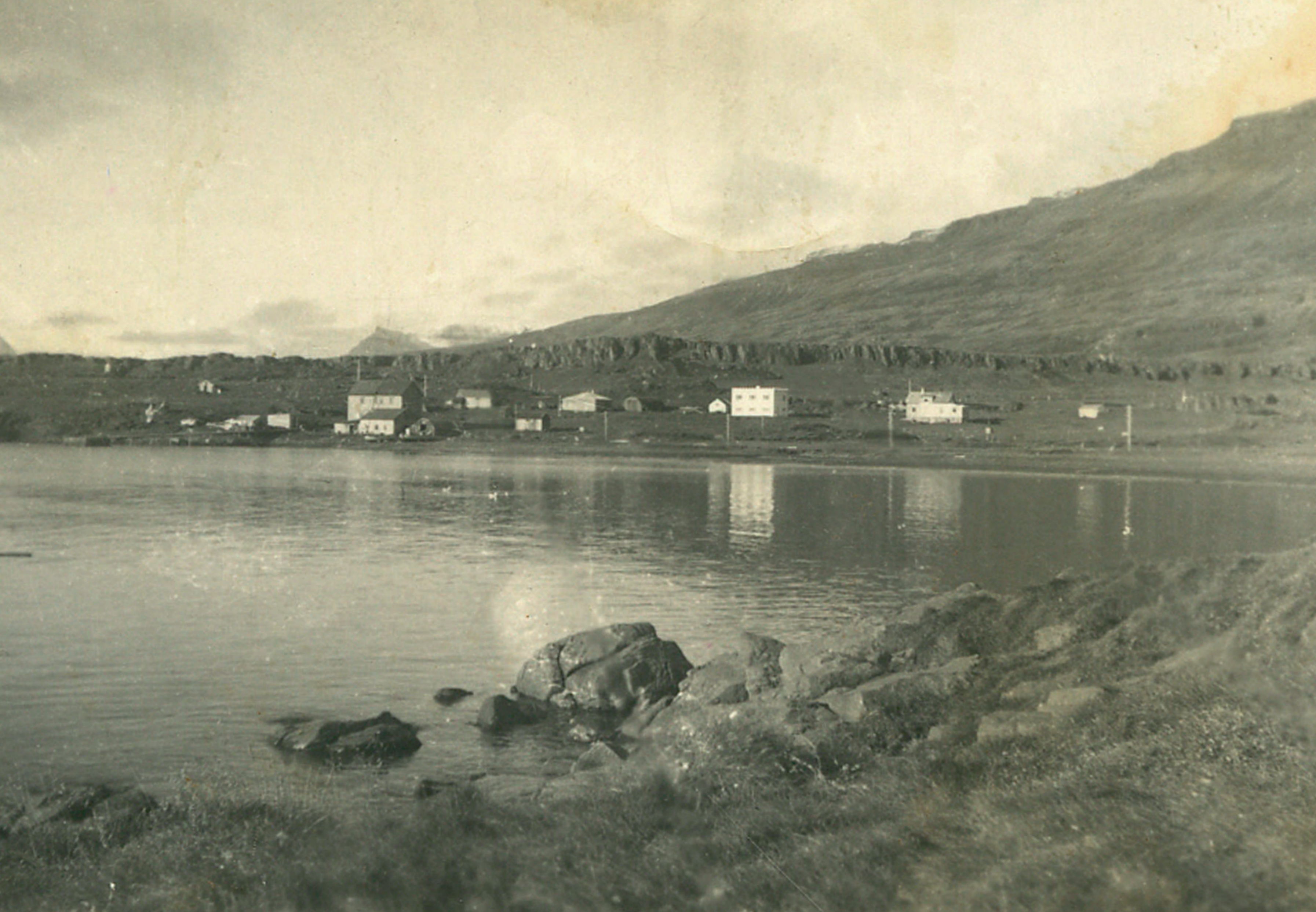
Breiðdalsvík á árum síðari heimsstyrjaldar.