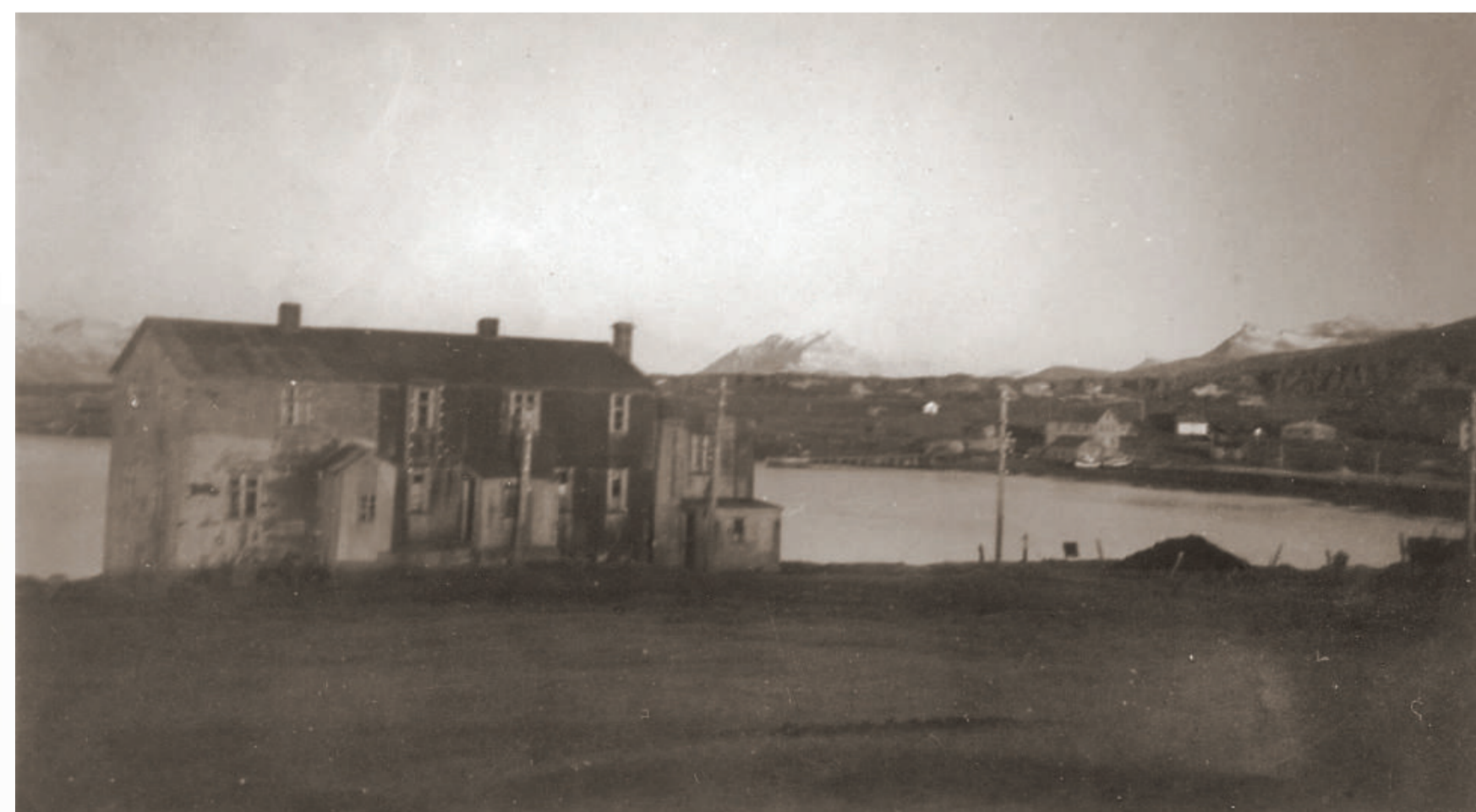
Gamli Selnesbærinn og Breiðdalsvík í bakgrunni.