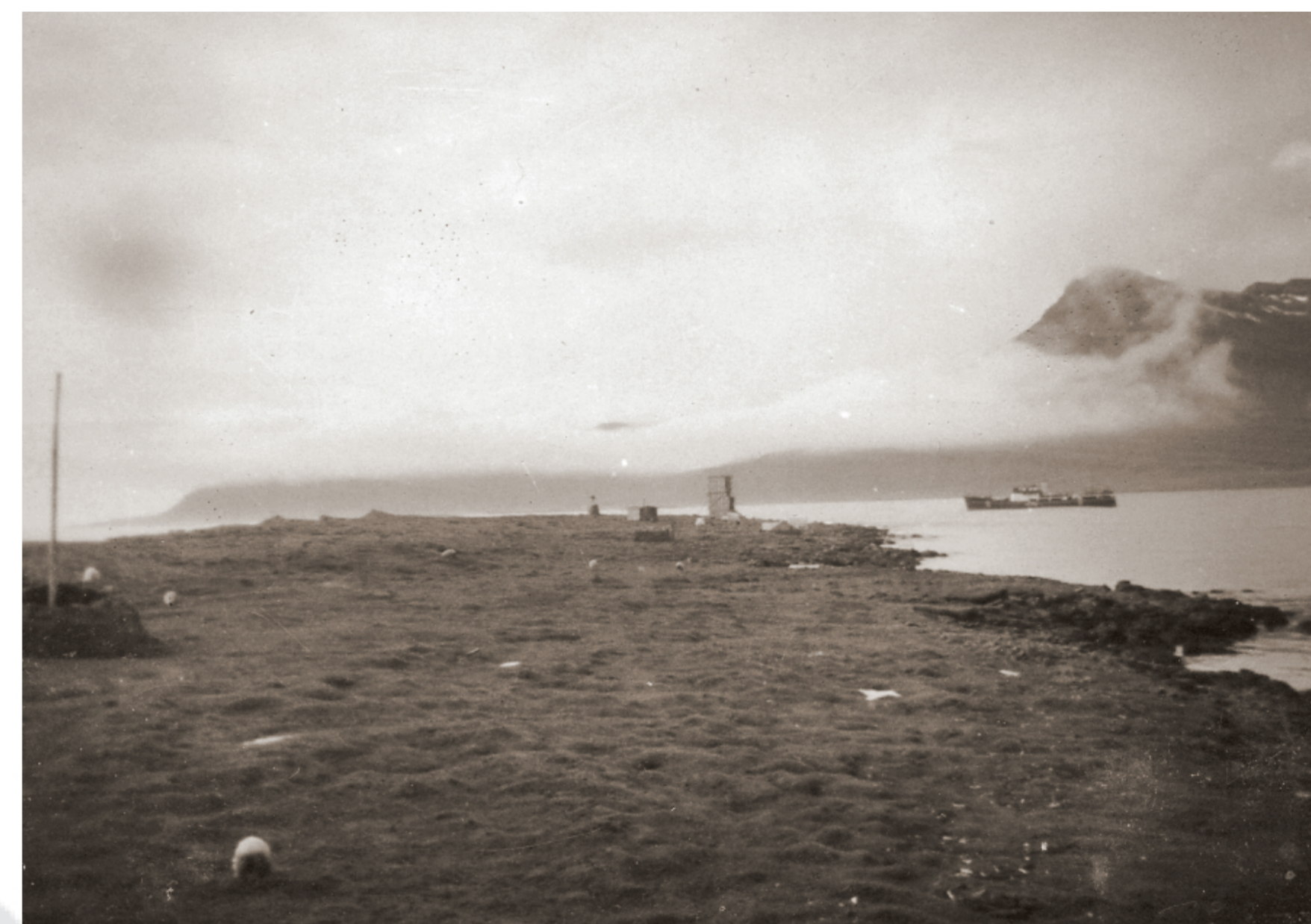
Selnesviti ný uppsteyptur 1942 og strandferðarskip á legunni.

Árið 1942 var loks reistur 8,5 m hvítur vitturn á Selnesi og lýsti vitinn sæfarendum inn á vikina frá 15. júlí til 1. júní ár hvert.