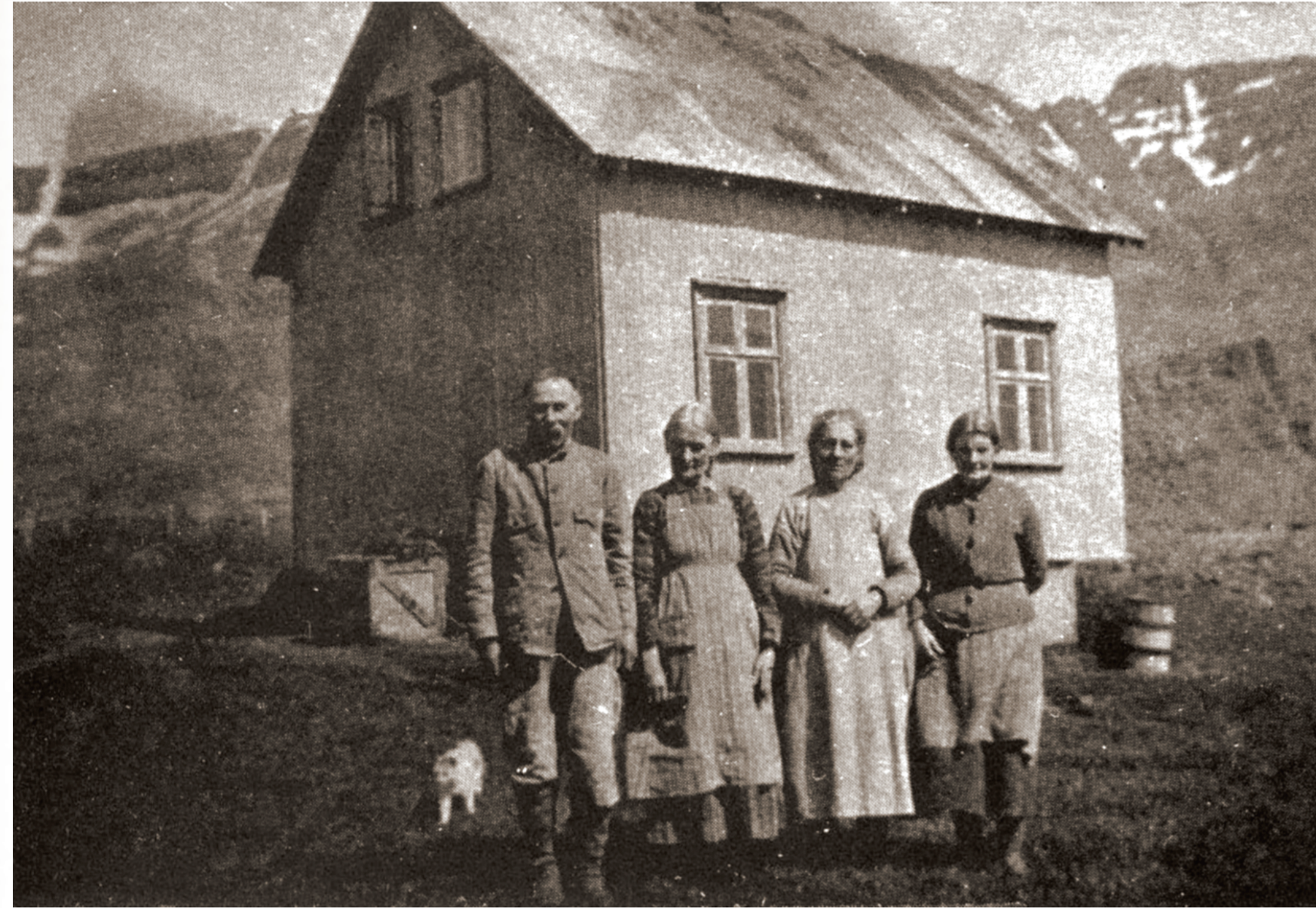
Íbúðarhúsið Ás í upphaflegri gerð.