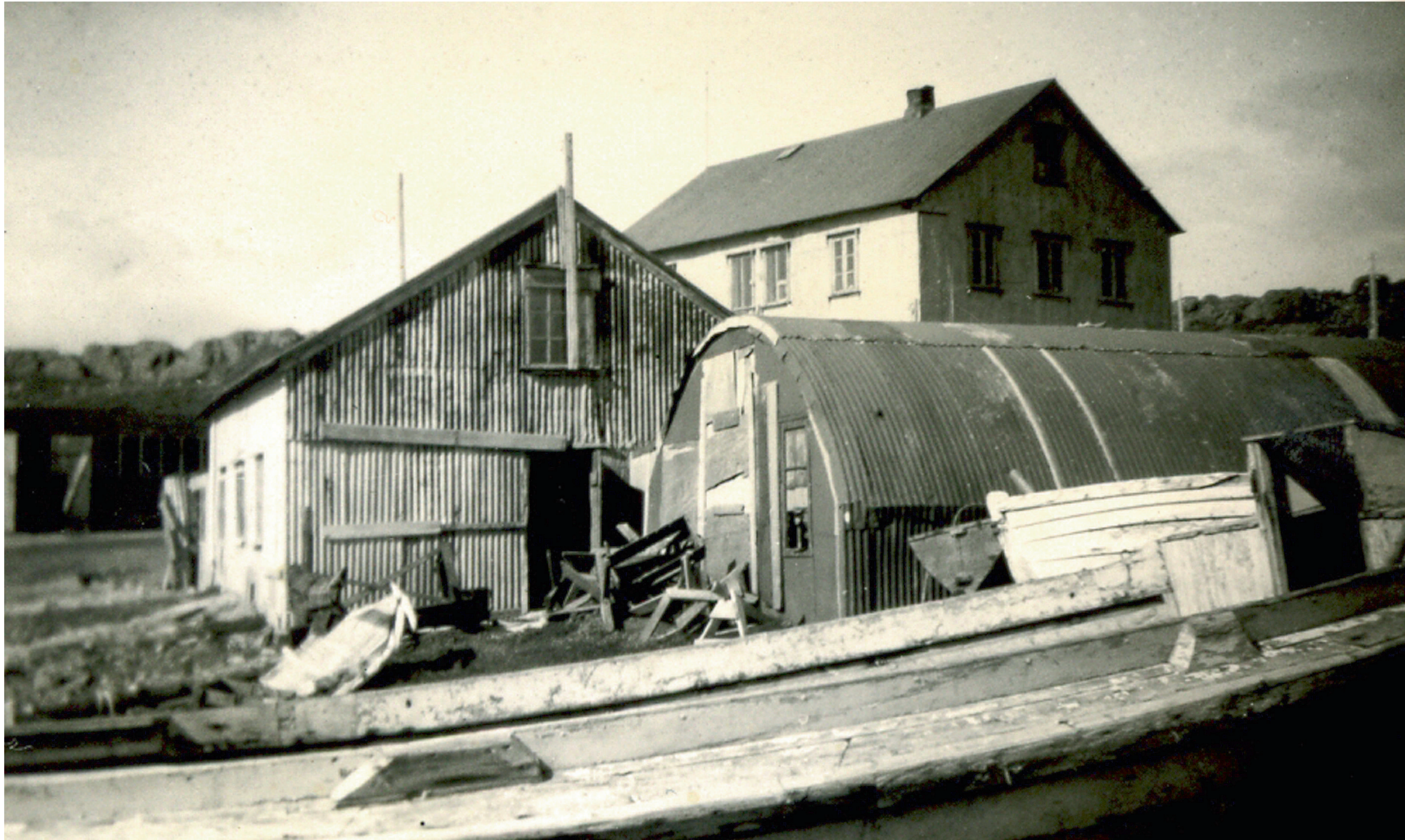
Breiðdalsvík á fjórða áratugnum.