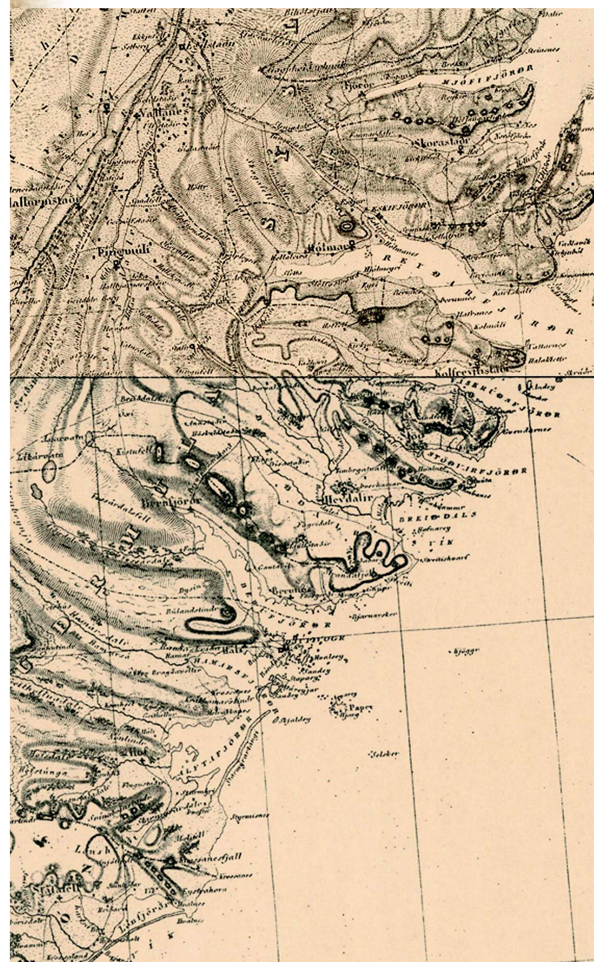
Meginverslun Breiðdælinga var lengst af á Djúpavogi.