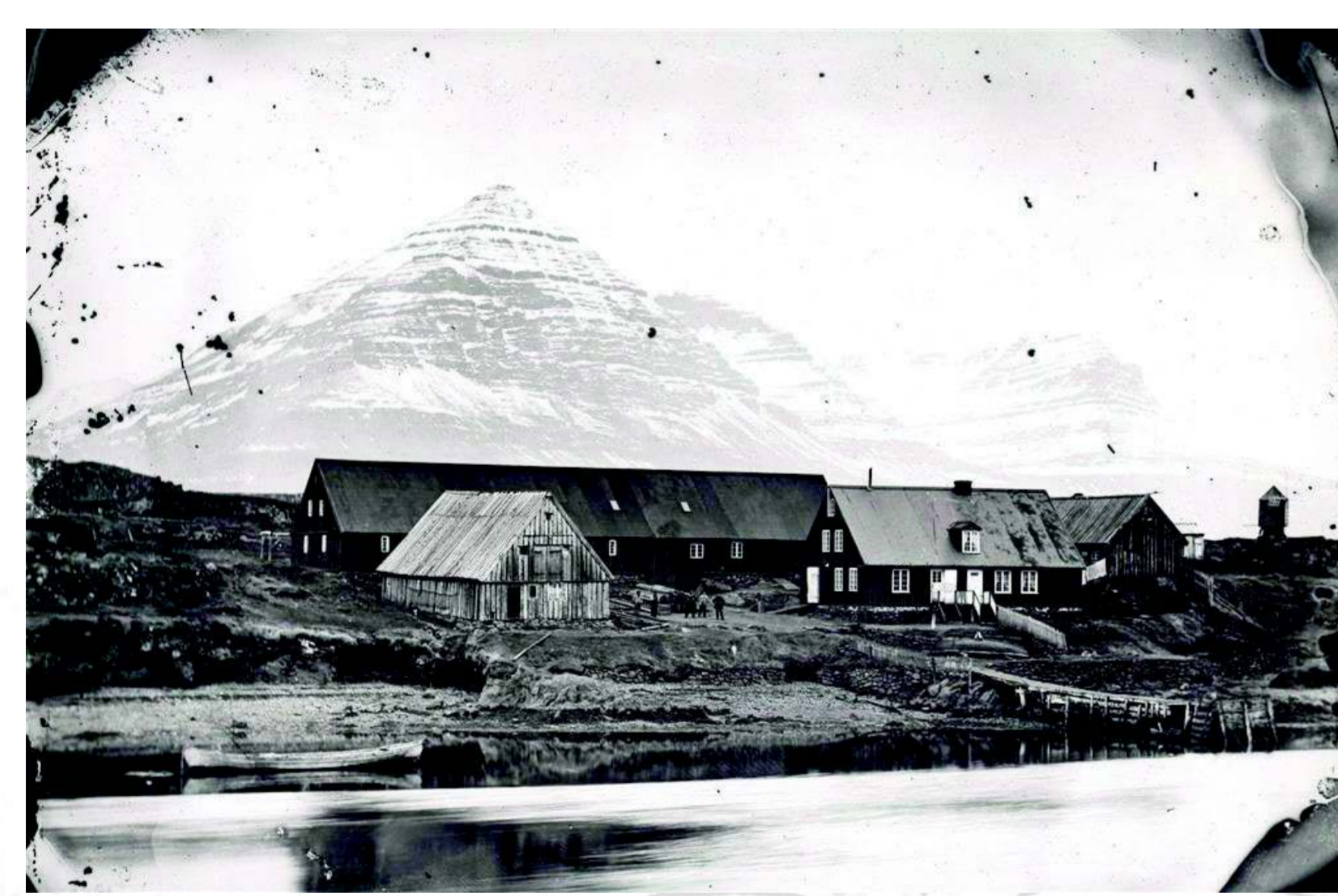
Verslunarstaðurinn á Djúpavogi seinni hluta 19. aldar. Langabúð og Faktorshús í forgrunni.

Allir vildu ólmir fá að fara í kaupstaðarferðirnar enda viðlíka mannamót ekki á hverju strái. Oft þurftu bændur að bíða tvo eða þrjú daga eftir afgreiðslu og á meðan stytti hver öðrum stundir. Búið var í tjöldum á meðan staldrað var við á Djúpavogi.